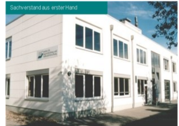
Von Sachverständigen für Sachverständige!