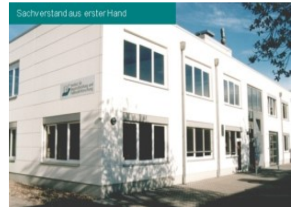
Von Sachverständigen für Sachverständige!