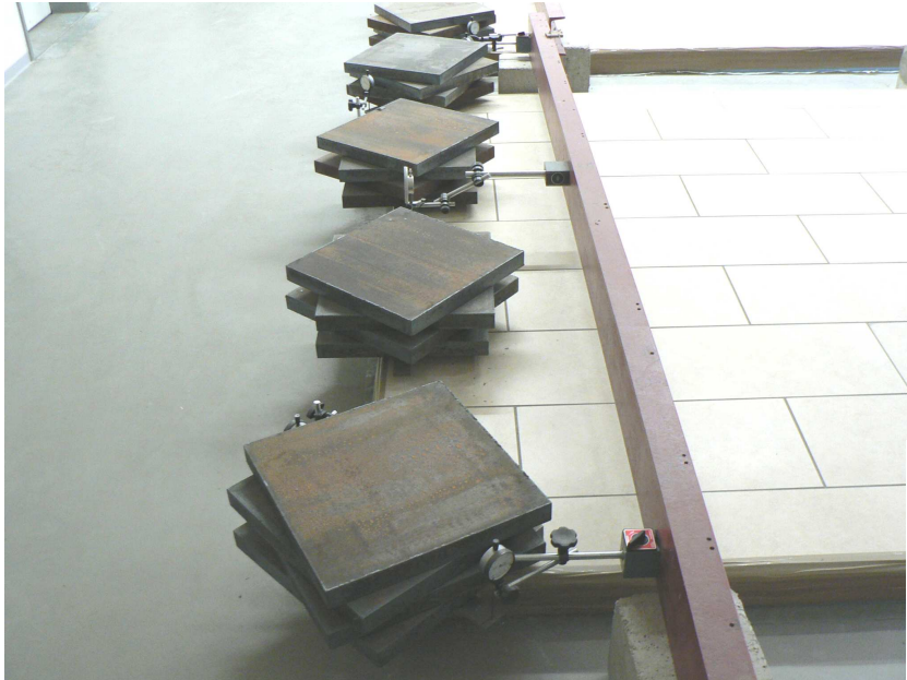
Bild 5: Punktbelastung (Einzellast) aus Stahlplatten am Plattenrand der Versuchsfläche ca. 6 m x 3 m zur Prüfung des Verformungs- und Tragfähigkeitsverhaltens

Zum Nachweis des Verformungs- und Tragfähigkeitsverhaltens dieser Sonderkonstruktionen haben sich Messungen an raumgroßen Versuchsflächen mit den Abmessungen ca. 6 m x 3 m bewährt. Diese Versuchsflächen werden praxisgerecht hergestellt und können mit den vorgesehenen Bodenbelägen belegt werden. Zur Prüfung des Verformungsverhaltens werden die Versuchsflächen mit Messbrücken aus Stahlträgern überspannt, an denen an den signifikanten Punkten (z.B. Plattenecken und Plattenränder der Versuchsflächen) Messuhren befestigt werden können. Weitere Messuhren können an auf Metallblechen fixierten Magnethaltern befestigt werden. Mit Hilfe dieser Messuhren können die vertikalen Verformungen der Versuchsflächen infolge Schwind- und Temperatureinflüssen sowie bei Belastung durch Verkehrslasten kontinuierlich erfasst werden.