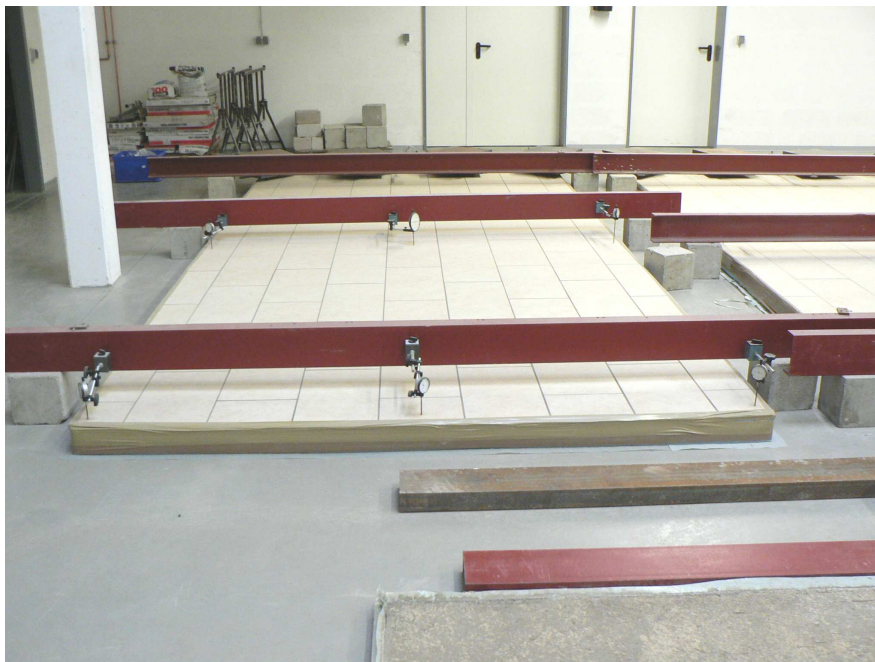
Bild 4: Versuchsfläche ca. 6 m x 3 m zur Prüfung des Verformungs- und Tragfähigkeitsverhaltens