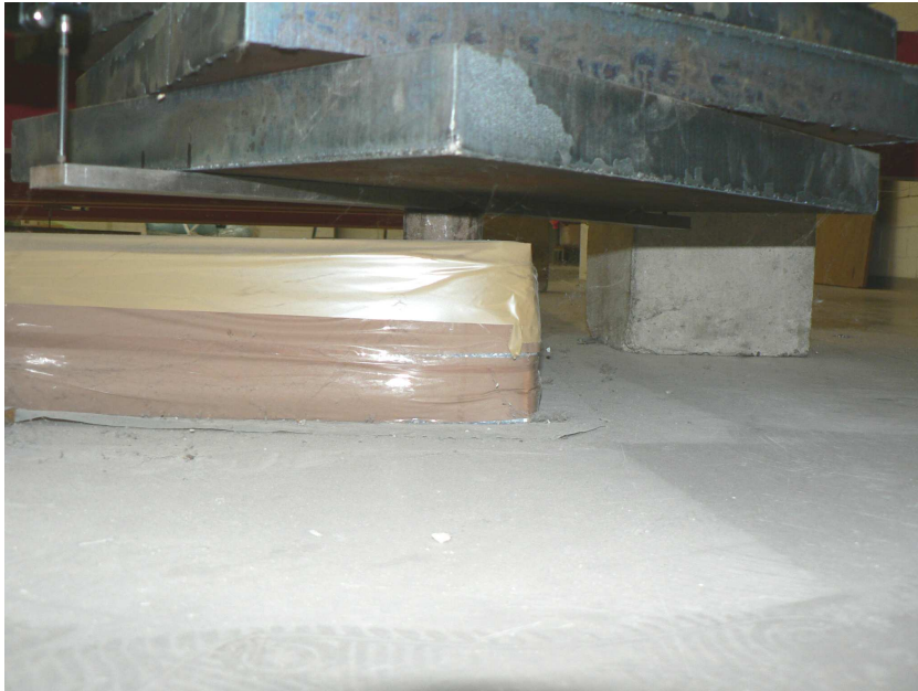
Bild 6: Metallstempel von 50 mm Durchmesser zur Einleitung der Punktbelastung (Einzellast) in den Fußboden (Metaltraverse zur Aufnahme der Messfühler der Messuhren befindet sich zwischen Metallstempel und Stahlplatten)

Die Fußbodenkonstruktion kann als geeignet eingestuft werden, wenn bei der Prüfung keine Risse festgestellt werden und wenn die im Bereich der Plattenecken und Plattenränder festgestellten vertikalen Verformungen nicht zu groß sind. Dabei bleibt die Verkehrsbelastung solange bestehen, bis die vertikalen Verformungen nicht weiter zu nehmen. In der Regel sollten die vertikalen Verformungen unter Verkehrsbelastung dabei ein Maß von etwa 3 mm nicht überschreiten.