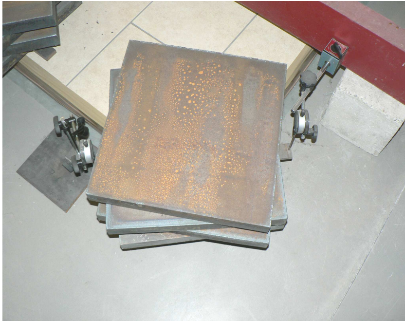
Bild 7: Messuhren zur Prüfung der vertikalen Verformungen der Versuchsfläche (Metalltraverse zur Aufnahme der Messfühler der Messuhren befindet sich zwischen Metallstempel und Stahlplatten)

Anhand der beim Bruch vorhandenen Punktbelastung (Einzellast) und den beim Aufbringen der Punktbelastung (Einzellast) festgestellten vertikalen Verformungen kann auf die zulässige Verkehrsbelastung der Fußbodenkonstruktion geschlossen werden. Bei der Festlegung der zulässigen Punktbelastung (Einzellast) sind entsprechende Sicherheitswerte zu berücksichtigen. Zur Absicherung des Prüfergebnisses sollte mit der bei dieser Prüfung ermittelten zulässigen Punktbelastung (Einzellast) der oben beschriebene Versuch an raumgroßen Versuchsflächen angeschlossen werden, mit dem das Langzeitverhalten und die in der Praxis vorliegenden Gegebenheiten zusätzlich erfasst werden können.