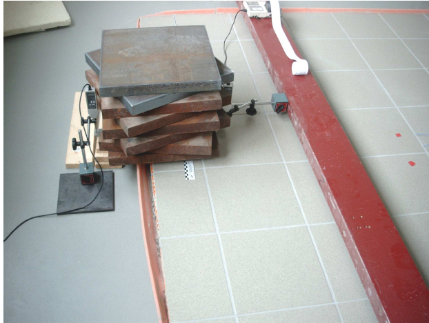
Bild 2: Punktbelastung (Einzellast) aus Stahlplatten am Plattenrand der Versuchsfläche zur Durchführung der orientierenden Prüfung

sind Sonderkonstruktionen gefragt, die einen Fußbodenaufbau mit geringerer Dicke bzw. Konstruktionshöhe ermöglichen. Für diese Sonderkonstruktionen muss aber ein Nachweis vorliegen, dass trotz der geringeren Dicke eine ausreichende Tragfähigkeit vorliegt und dass sich der Fußboden bei Belastung durch Verkehrslasten nicht zu stark verformt.