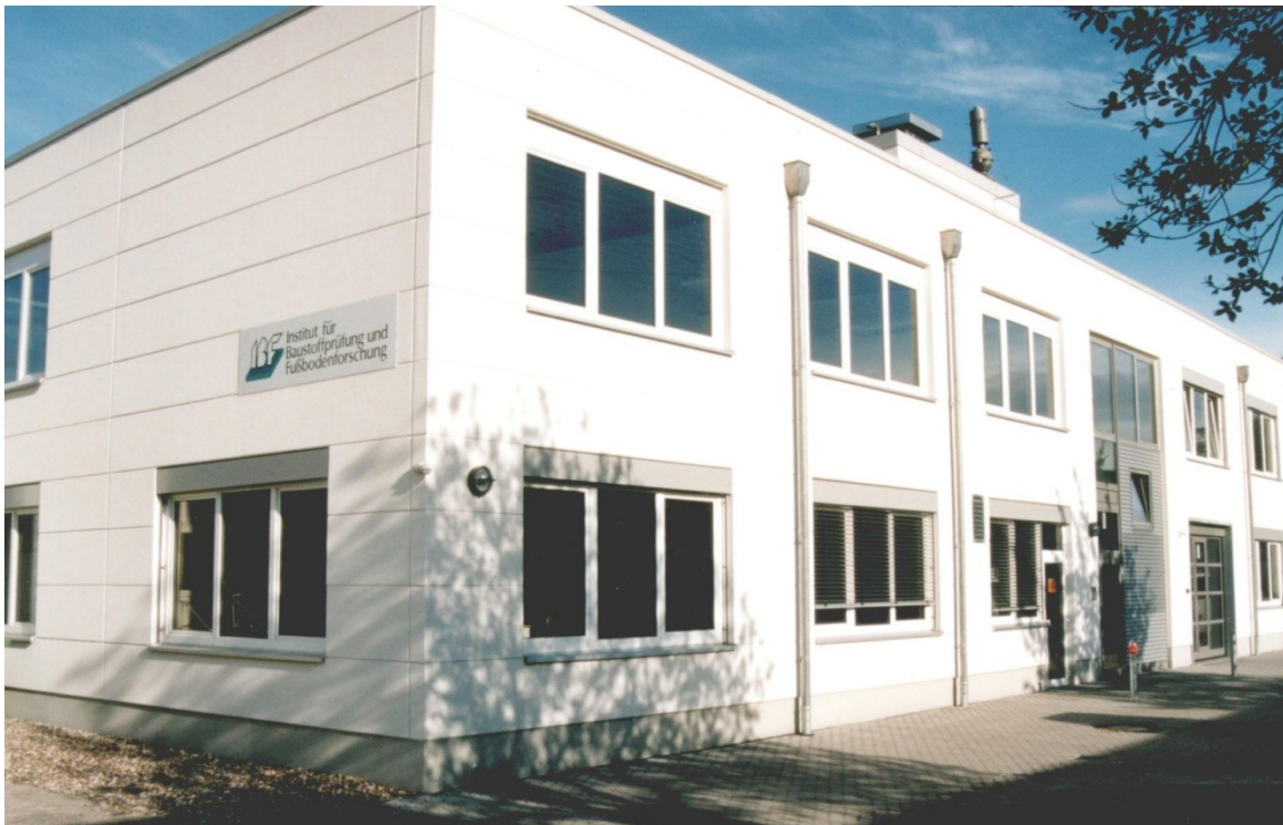
IBF - Institut für Baustoffprüfung und Fußbodenforschung